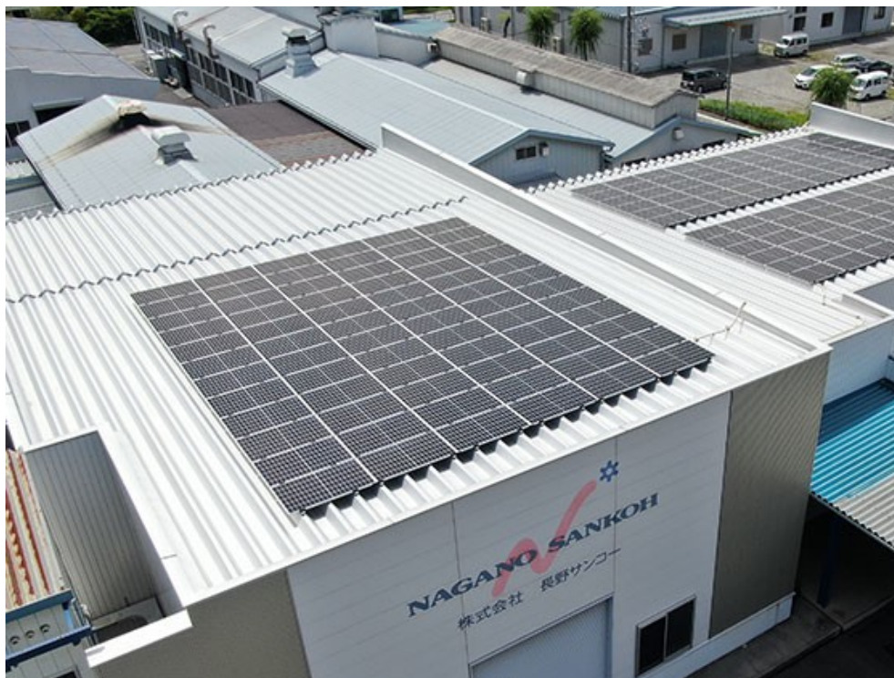
弊社やなぎ通り工場の屋根に設置された太陽光パネル

年間発電量： 67, 222kWh 年間原油換算削減量 17, 276 [L] 二酸化炭素排出削減効果： 年間 38,922kg-CO2